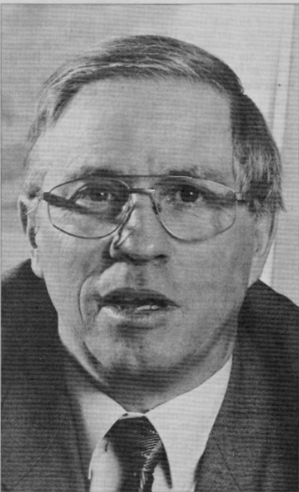
Der Politiker Christoph Blocher ist auch ein Kunstsammler.

Ich habe an sich ein zwispaltiges Verhältnis zur Religion. Aber dass die Welt von der Gnade des Gegebenen gelenkt ist, steht für mich fest und entspricht der Zuversicht, die Ankers Werk ausstrahlt. «Die beiden Pfarrer» sind für mich eine Karikatur der Religion; ihre stehenden Augen, ihr frommelndes Gebilde, das verrät, dass sie nicht sind, was sie vorgeben wollen, und das alles in die Natur gestellt – da