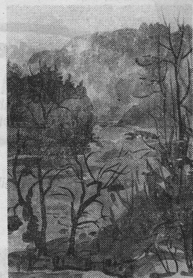
«Reuss im Zopfau», Aquarell von Max Byland, Aarburg.

Durch ein geschicktes Wechselspiel von verdünnter und satter Farbe desselben Braun-, Grün-, Blau- oder Gelbtönen gewinnt die Landschaft an Zeichnung und Lebendigkeit. Immer wieder ist es das Wasser, die Fluss- oder Bachlandschaft, die ihn fesselt und die es ihn drängt, in seinen subtil empfundenen, atmosphärischen Farben aufs Papier zu bannen.