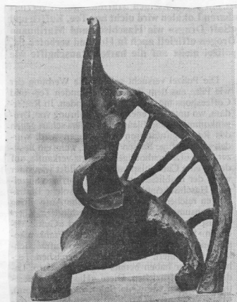
Frauengestalten prägen das Schaffen Laurens': Harfenspielerin (1937).

Werke des Plastikers Henri Laurens (1885-1954) im Kunstmuseum Bern