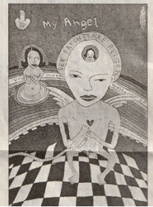
Silly Mano (geb. 1967): «My Angel», Tiefdruck Aquatinta.

Gleichzeitig mit der Weihnachtsausstellung des Kunstvereins findet jeweils die Mitgliederversammlung der ganzen Schweiz offene Jahreshausausstellung des Photoforums statt. Wegen der Kurzfristigkeit haben sich dieses Jahr zwar nur 49 Fotokünstler um eine Teilnahme beworben, doch die 31 angenommenen geben durchaus Einblick in aktuelle Tendenzen. Erstaunlich, dass 80% der Eingaben schwarz- Weiss sind. Bezeichnend die Vergabe des