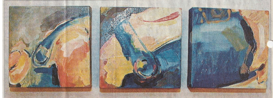
Bettina Wachter (geb. 1967): Komposition I, II und III, Öl auf Baumwollstoff und Papier.