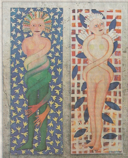
Esther Lisette Ganz (geb. 1950): «dasein», «unendlich», Acryl auf Leinwand.

Die Vernissage der Weihnachtsausstellung findet heute Samstag, 4. Dezember, um 17 Uhr statt. Der Ort: Die ehemalige Swisscom-Industriehalle an der Aarbergstr. 72 (Nähe J.J. Rousseau-Platz). Dauer: Bis 9. Januar. Öffnungszeiten: Mi/Do/ Fr 14 - 18, Sa/So 11 - 17 Uhr.